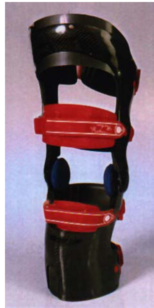
Genouillère articulée en carbone

utilisée en cas de lésion ligamentaire avec déviation en varus ou en valgus. Butée de limitation.